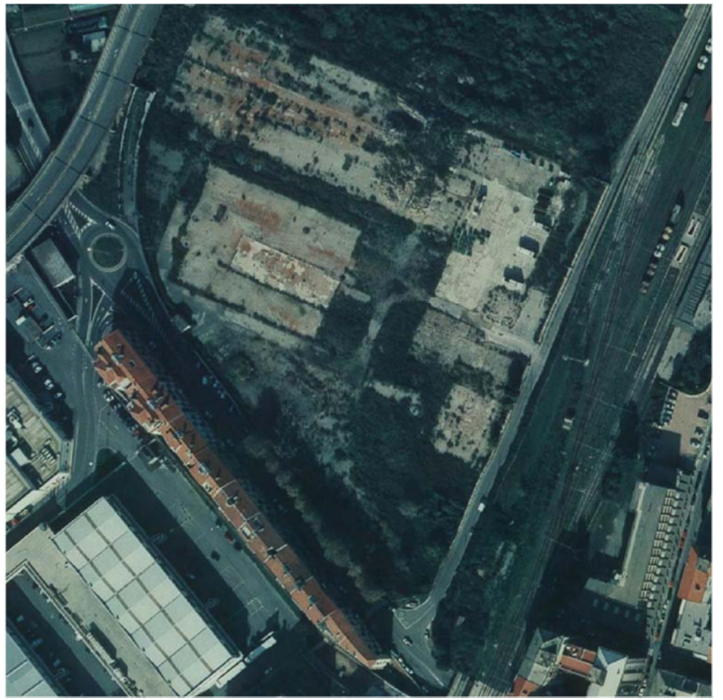
STATO DI FATTO ORTOFOTO